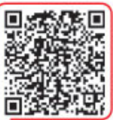
آموزش و تمرین سماعی

در درس پنجم یاد گرفتیم که شاعر بنا به ضرورت و طبق اختیارات زبانی می‌تواند در تلفظ شعر تغییری ایجاد کند. حالا باید دسته دوم اختیارات یعنی اختیارات وزنی را بررسی کنیم. اختیارات وزنی آن دسته از اختیاراتی هستند که شاعر طبق آن، تغییراتی اندک در وزن شعر ایجاد می‌کند. اختیارات وزنی ۴ نوع هستند: